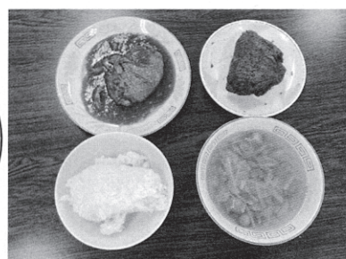
↑おいしくいただきました