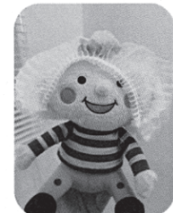
▲ほべたんも一緒に見学!

参加者から、「来年もバスでフェスタに参加したい」「集品センターの規模を直接見れて良かった」などの声をいただきました。ご参加、ありがとうございました!