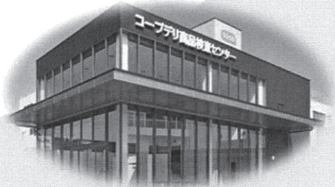
コープデリ商品検査センター