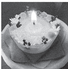
・フローティングキャンドル・

水に浮かべて火を灯し、そのゆらぎに癒されるフローティングキャンドル。小さなドライフラワーを選んで散りばめたので色鮮やか。そのまま飾っても可愛いです。