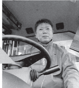
除雪機も運転できます!!

カフェ初めての方も大歓迎です！ 楽しくおしゃべりしながらスイーツ を楽しみましょう♡