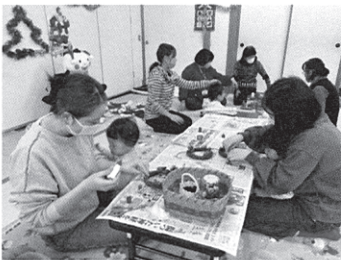
お子さんとリース作り♪

12月はクリスマスにちなんで、いつもよりもスペシャルなひろばを開催しました☆ 内容はクリスマスリース作りやコープ商品試食、フォトスポットなどなど…♪参加されたお母さんもお子さんも、そしてスタッフも、み～んな楽しく笑顔溢れる温かいひろばとなりました。 参加者からは、「子どもと一緒にリース作りができて楽しかった」「買ったことのない商品のお試しもできて良かった」「天気が悪くなってきて外遊びができない中、ホールで思う存分走り回ったりと体を動かせてありがたいです！」などの感想をいただきました。