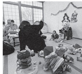
にぎやかフォトスポット♪