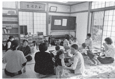
もぐもぐ試食タイム♪