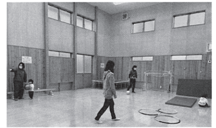
広いホールで元気いっぱい♪