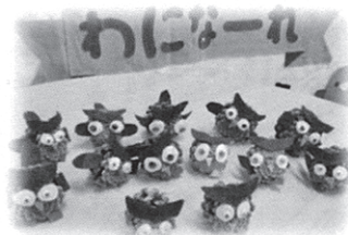
●松ぼっくりのふくろう