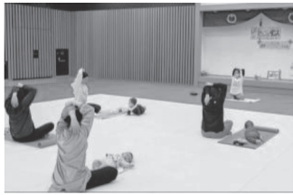
のびのびストレッチ