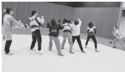
みんなでぐるぐる♪