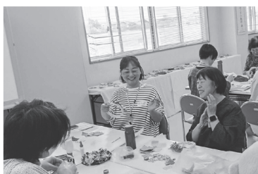
おしゃべりしながらリース作り