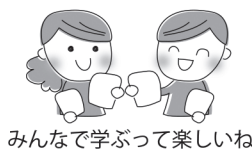
みんなで学ぶって楽しいね