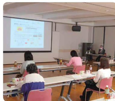
▲昨年の春の地区別総代会議*のようす (コープにいがた)

今回の総代会議は、新型コロナウイルス感染防止の観点から総代のみでの開催とし、例年おこなっていたオブザーバーの参加募集はいたしません。