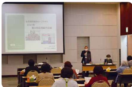
▲昨年の春の地区別総代会議*のようす (コープクルコ)