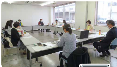
▲交流会に参加したみなさん。オンラインで参加したメンバーさんも