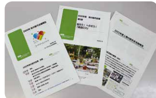
▲「秋の総代会議」の資料

「秋の総代会議」が11月7日～11月23日、県内24会場(オンライン2会場を含む)で開催されました。第1部では、上期の事業状況・組合員活動報告と、下期の課題・取り組みなどについての報告がありました。第2部では、「知ろう!へらそう!食品ロス」と題して、食品ロス削減についてスライドで学習した後、グループで交流しました。(参加した方々から寄せられたアンケートの一部を紹介します)