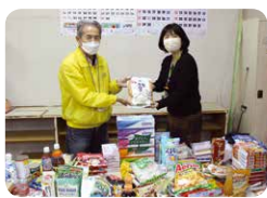
▲各会場であつまった商品は、フードバンクにお渡ししました。

「秋の総代会議」が11月7日～11月23日、県内24会場(オンライン2会場を含む)で開催されました。第1部では、上期の事業状況・組合員活動報告と、下期の課題・取り組みなどについての報告がありました。第2部では、「知ろう!へらそう!食品ロス」と題して、食品ロス削減についてスライドで学習した後、グループで交流しました。(参加した方々から寄せられたアンケートの一部を紹介します)