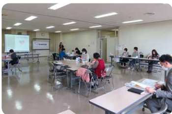
▲11/8新発田市カルチャーセンター