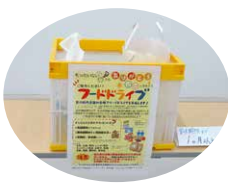
会場内に「フードドライブ」のコーナーを設け、参加者に協力していただきました