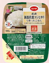
CO-OP 産直 新潟佐渡 コシヒカリで作ったごはん 1個