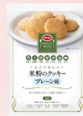
CO-OP 7品目を使わない 米粉のクッキー プレーン味 1個

※「ワン・モア・ライス」やってみた宣言」や「ワン・モア・ライス」アイデア」は何回でも投稿していただけますが、プレゼントの応募は期間中1人1口とさせていただきます。なお、プレゼント企画の対象は組合員とさせていただきます ※賞品の発送は11月中旬を予定しています。厳正な抽選により当選者を決定し、賞品の発送をもって発表にかえさせていただきます。 なお、抽選方法や当選についてのお問い合わせは受け付けておりません