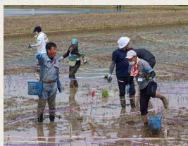
今年5月に行われた田植え交流の様子。組合員やその子どもと一緒に、さまざまな品種の稲を植える「田んぼアート」や生きもの調査を行った

「ワン・モア・ライス」について、生産者としての受け止めはいかがですか。 非常に良い取り組みだと思います。1週間に1杯だけでなく、できれば1日にもう1杯食べてほしいですね(笑)。そうすれば需給調整もすなわたり、食料自給率も上がると思いますが、いきなりそこまで無理なので、1週間に1杯、2杯、お米やお米を原料としたものを食べてもらえればと思います。ただ食べるだけではなく、日本や地域の環境が守られていくことも考えてほしいですね。これからは、佐渡では生きもの、トキ、人、地球環境という視点で米づくりを続けていきます。皆さんの交流も続けていきたいと思っていますので、ぜひ一緒に歩いていただけるとうれしいです。