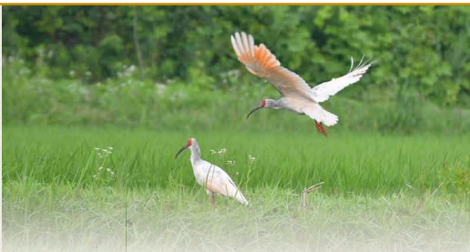
田んぼの中を舞い、エサのドジョウやカエルをついばむトキ。2023年時点で野生下のトキは500羽を超えた

佐渡ではトキと共生する「生きもの育む農法」を続けています。始めた当初と比べ何が変わりましたか。 一番の成果はトキが増えたことです。それは生きものが田んぼに生息しているからこそ。農薬を減らしたため、カメシなど米の害虫は当然います。トキの放鳥前、農家はお米と害虫しか見ていませんでした。でも今の佐渡の農家は、害虫も当然見ますが、それを食べているクモなどの益虫、トンボやカエルも含めた生きものがいるかを確認します。農薬を減らしても、昔に比べて害虫の被害は減っています。生態系のバランスが保たれ、益虫が害虫を食べるから、その分農薬を減らせるのです。佐渡にはいろいろな生きものが多い。田んぼはお米だけではなく、生きものも、そして風景も育てているという感覚があります。