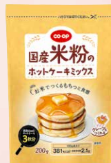
CO-OP 国産米粉の ホットケーキミックス 1個