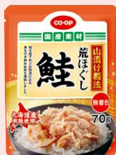
CO-OP 山漬け製法 荒ぼぐし鮭 1個