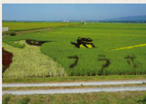
2023年の田んぼアート。今年のテーマは東京都在住の小学生が考案した「わたしたちと田んぼのつながり」