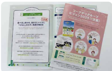
▲秋の総代会議で配付された「コープデリグループビジョン2035」＜1次案＞の資料

「コープデリグループビジョン2035」は今後＜最終案＞に向けて検討を進め、2024年6月に開催される第3回通常総代会で総代の皆さんから承認していただく予定です。