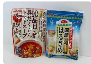
▲参加した総代さんへのおためし商品