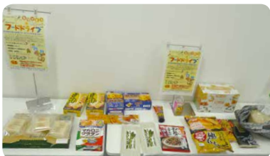
▲会場内に「フードドライブ」のコーナーを設け、参加者に協力していただきました