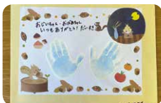
▲会場で作った手形足型