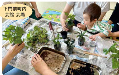
下門前町内会館会場