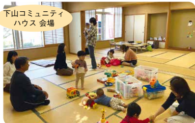
下山コミュニティハウス会場