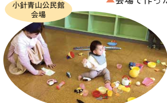
小針青山公民館会場