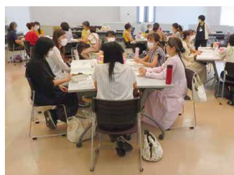
▲昨年の総代学び交流会