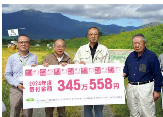
10月、田んぼアートの前で寄付金贈呈式を開催。組合員から生産者への応援メッセージもお渡ししました

2024年度寄付額 345万558円 累計寄付額 (15年間) 3,972万2,653円