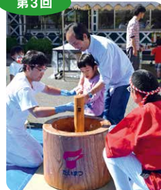
10/12 餅つき後、 おいしいお餅の試食も しました