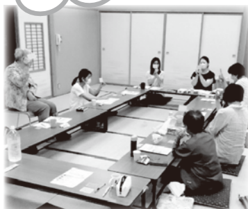
▲23年度「会場参加型ほぺたんカフェ」の様子

「ほぺたんカフェ」は毎月1回、登録したメンバーが集まって、コープの商品や食・くらし・子育て・地域のことなど、いろいろなことを皆さんと一緒にしゃべりする「楽しくてためになる場」です。23年度は180人の登録がありました。24年度も「会場参加型」と「オンライン型」を募集します！お気軽にご参加ください。