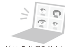
▲「オンライン型ほぺたんカフェ」夜の部も登場！

詳細は、2月26日から配付の募集チラシやコープデリにいがたのホームページをご覧ください