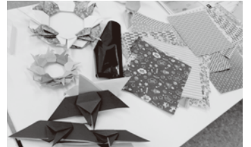
▲平和への思いを込めた作品ができました