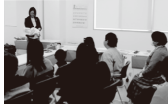
▲平和の絵本の読み聞かせの様子