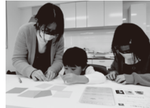
▲折り鶴リースを一緒に作りました