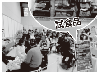
コープ商品紹介コーナー