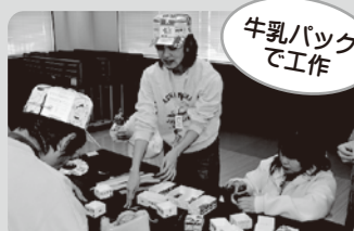
牛乳パック de 工作