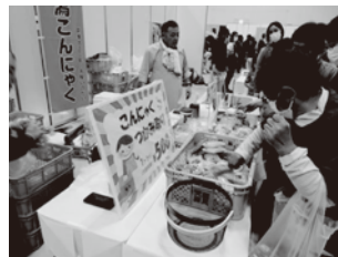
野菜の販売や試食・販売ブースは、 大勢の方々に賑わいました