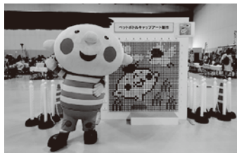
ほべたんのペットボトルキャップ アート。当日はたくさんのペット ボトルキャップが集まりました！