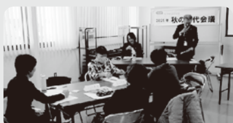
▲11/20 両津地区公民館（佐渡市）