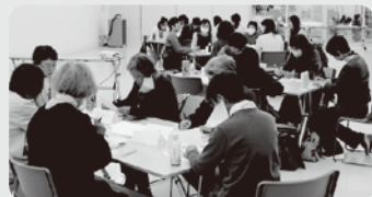
▲11/21 三条東公民館（三条市）

能登半島の復興応援の気持ちを込めて、石川県七尾市のメーカー「スギヨ」のCO・OP 蟹足風力ニカマを試食しました。