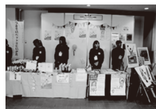
つきそいベッド@にいがた 小児がん支援の取り組み （レモネードスタンド）