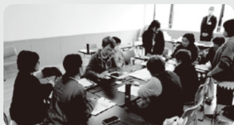
▲11/7 糸魚川地区公民館（糸魚川市）

会議の前半の第1部では、コープデリにいがた上期の事業状況・組合員活動についてと下期の課題・取り組みなどを報告しました。後半の第2部では、能登半島地震・奥能登豪雨災害支援の報告を行った後、報告の感想や自分でできる防災・減災についてグループで交流しました。