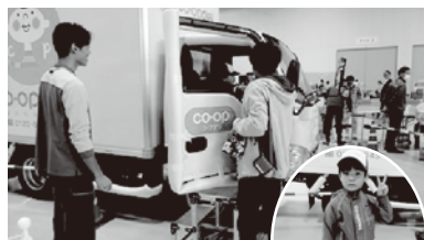
コープデルのトラック 乗車体験コーナー

11月2日（日）、新潟市産業振興センター（新潟市中央区）にて、組合員・新潟県民の皆さまへの感謝を込めた「コープデリにいがたフェスタ2025」を昨年に引き続き開催しました。会場では、コープデリにいがたの紹介や、宅配でおなじみのメーカー、産地や関係団体など40社以上のブースを出展し、約6,000人の皆さまにご来場いただきました。また、「佐渡トキ応援お米プロジェクト」2025年度寄付金の贈呈式を行ったほか、今年の国際協同組合年を受け、協同組合の価値や意義について役職員が学び発信するために、「2025年国際協同組合年アピールコーナー」を設置しました。