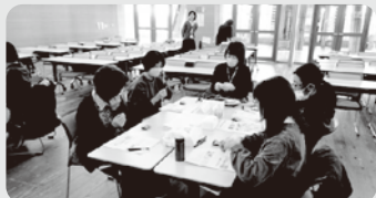
▲11/12 いくとびあ食花 食育・花育センター（新潟市中央区）