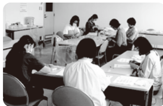
集められた切手などを仕分け、台紙に貼って換金します。この活動には、多くのボランティアの方々にご参加・ご協力いただきました。

この寄付金は、2025年1月～5月末にかけて、「はがき・切手回収キャンペーン」を実施し、組合員より寄贈いただいた書き損じ・未使用はがきや未使用切手などを換金し、専用封筒作成などの経費を引いた金額となります。この寄付金は、新潟県共同募金会において、県内の子ども・子育て支援に取り組む団体に助成・活用されます。今後もコープデリにいがたは、SDGsの実現に資する取り組みの一つ「誰一人取り残さない社会」の実現に向けて様々な活動を支援してまいります。