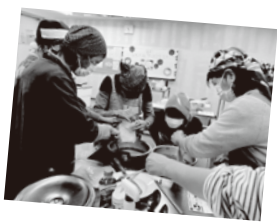
エリア委員が運営しているイベントの様子です

エリア委員は、新潟県内を5つに分けた各地域で、コープデリにいがたと組合員をつなぐさまざまな活動をすすめています。幅広い年代の方々が活躍しています！チームで活動するので、安心して活動できますよ！ぜひエリア委員になって一緒に楽しく活動しましょう！