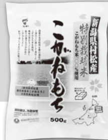
「新潟県村松産 特別栽培米こがねもち」

※日程については現時点の予定です。日程は変更になる場合があります。※各回「現地集合・解散」となります。※①②③の3回全ての日程にご参加をお願いします。