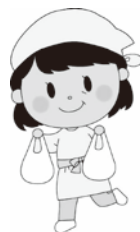
たす子さん 60代 夫と二人 健康な年金暮らしの のんびり屋さん