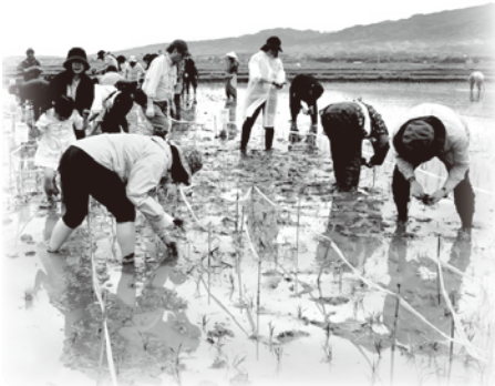
▲昨年も「田んぼアート」の田植えをしました

JA佐渡の協力のもと、田植えや稲刈りなどで交流を続けている「佐渡トキ応援お米プロジェクト」。5月は「田んぼアート」の田植えと、「佐渡の伝統芸能体験」です。佐渡の自然や生きものに触れ、おいしいものを味わえる企画です。皆様のご参加、お待ちしております。