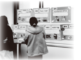
▲各グループの紹介コーナー

に活動する10グループが登録しています。当日は、各日3グループが参加し、活動内容の報告と交流を行いました。地域を良くしたい、困っている人を助けたいという想いで活動していることや、活動に参加している方のうれしい声も聞くことができました。また、グループ同士でコラボできそうとの声もあり、グループ活動の今後の可能性を感じた交流会でした。