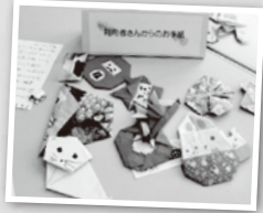
▲かわいらしい折り紙作品が届きました

お問い合わせ コープデリにいがた 総合企画室 リーディングサービス担当 TEL 025-260-3351 (月～金 9:00～17:30)