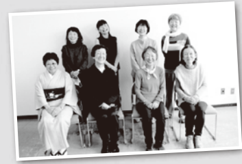
▲当日参加した「雪うさぎの会」のメンバー

交流会では、利用者さんから届いた感謝のお手紙やかわいらしい折り紙作品、お電話での温かなメッセージも紹介されました。こうした交流を通じて「より良い声の便りを届けたい」という想いをついにしたボランティアの皆さん。最後は、活動とともにする仲間同士、素敵な笑顔で記念撮影を行い、和やかなひとときとなりました。