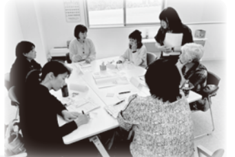
▲5/18 コープデリ上越センター (上越市)