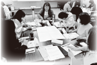
▲5/11 ハイブ長岡 (長岡市)