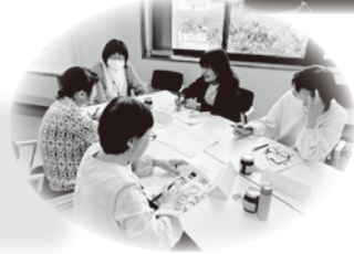
▲5/14 東豊コミュニティ 防災センター (新発田市)