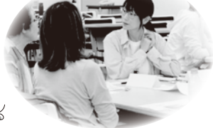
▲5/14 新潟ユニゾンプラザ (新潟市中央区)